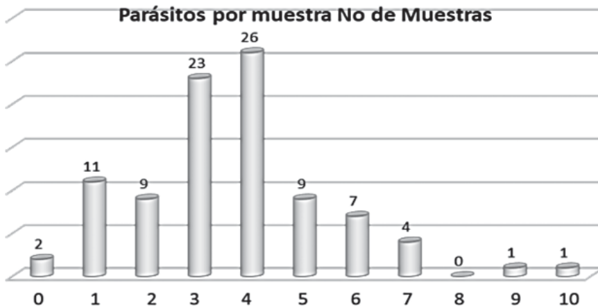
Gráfica No 2. Relación de Número de Parásitos por Muestras en las tres Escuelas

En la Gráfica 2, se puede observar la relación total del número de parásitos observados por muestra. El 52,7% de las muestras presentaron entre 3 y 4 parásitos y un 23,6% con entre 5 a 10 parásitos por muestra. Los hallazgos son preocupantes, aunque no sorprendentes para una zona tropical. Cabe destacar que el helminto de mayor difusión, Ascaris lumbricooides , encontrado entre el 13 y el 45% de las muestras, pertenece al Reino: Animalia, Phylum: Nematoda, Subclase: Secernentea, Orden: Ascaridida, Familia: Ascarididae, Género: Ascaris , Especie: lumbricooides , y tiene como reservorios al hombre y los cerdos. Este está categorizado como el parásito más fácil de contraer y más difícil de eliminar, dado que puede migrar a cualquier órgano, produce desde asma (pulmones) hasta ataques epilépticos (cerebro).