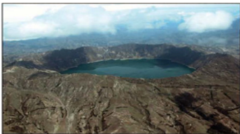
Figura 2. Vista aérea de la laguna craterica volcánica. Quilotoa. Cotopaxi. Ecuador.

Tomando en cuenta lo antes señalado, se realizó el presente estudio con